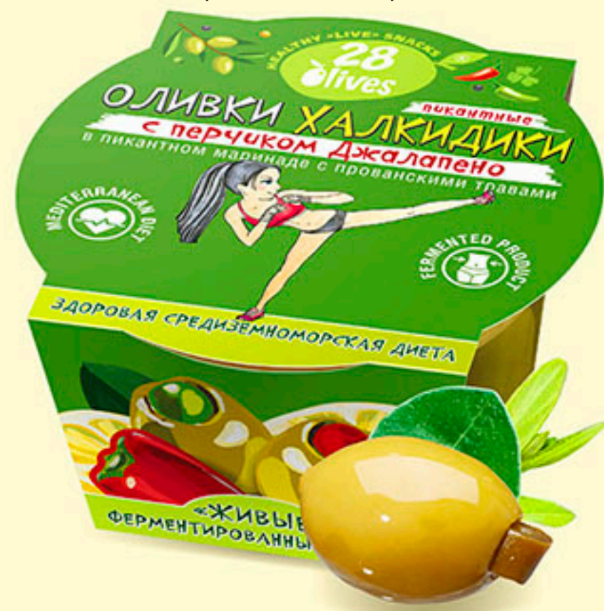
48 ОЛИВКИ ХАЛКИДИКИ с перчиком Джалапено в пряном маринаде с прованскими травами