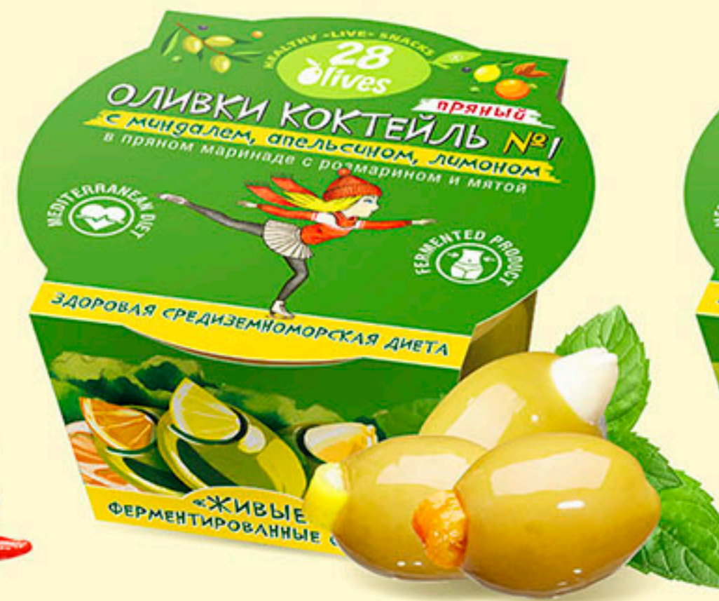
50 ОЛИВКИ КОКТЕЙЛЬ №1 с миндалем, апельсином, лимоном в пряном маринаде с розмарином и мятой