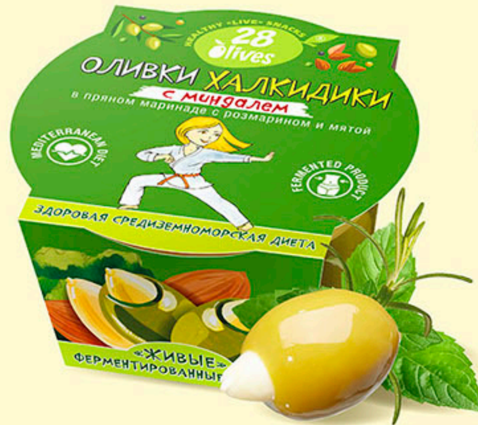
44 ОЛИВКИ ХАЛКИДИКИ с миндалем в пряном маринаде с розмарином и мятой