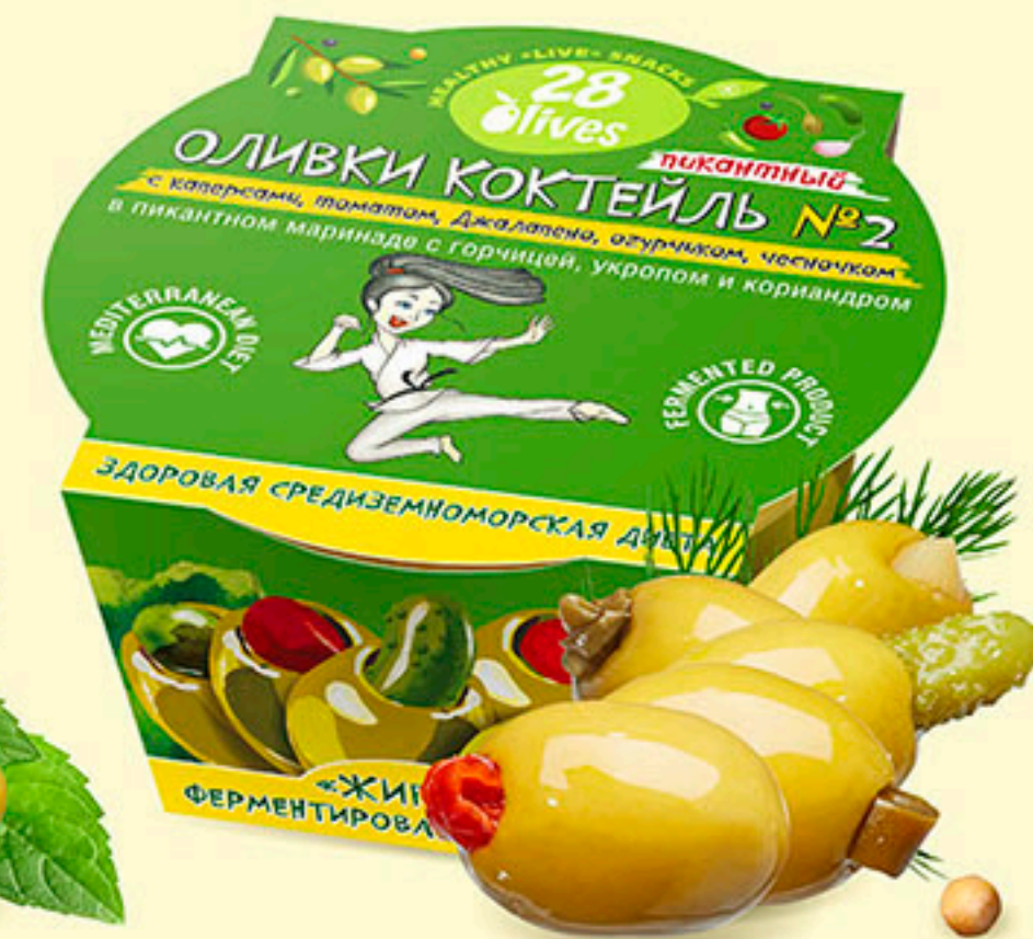
51 ОЛИВКИ КОКТЕЙЛЬ №2 с каперсами, томатом, Джалапено, огурчиком, чесночком в пикантном маринаде с горчицей, укропом и кориандром