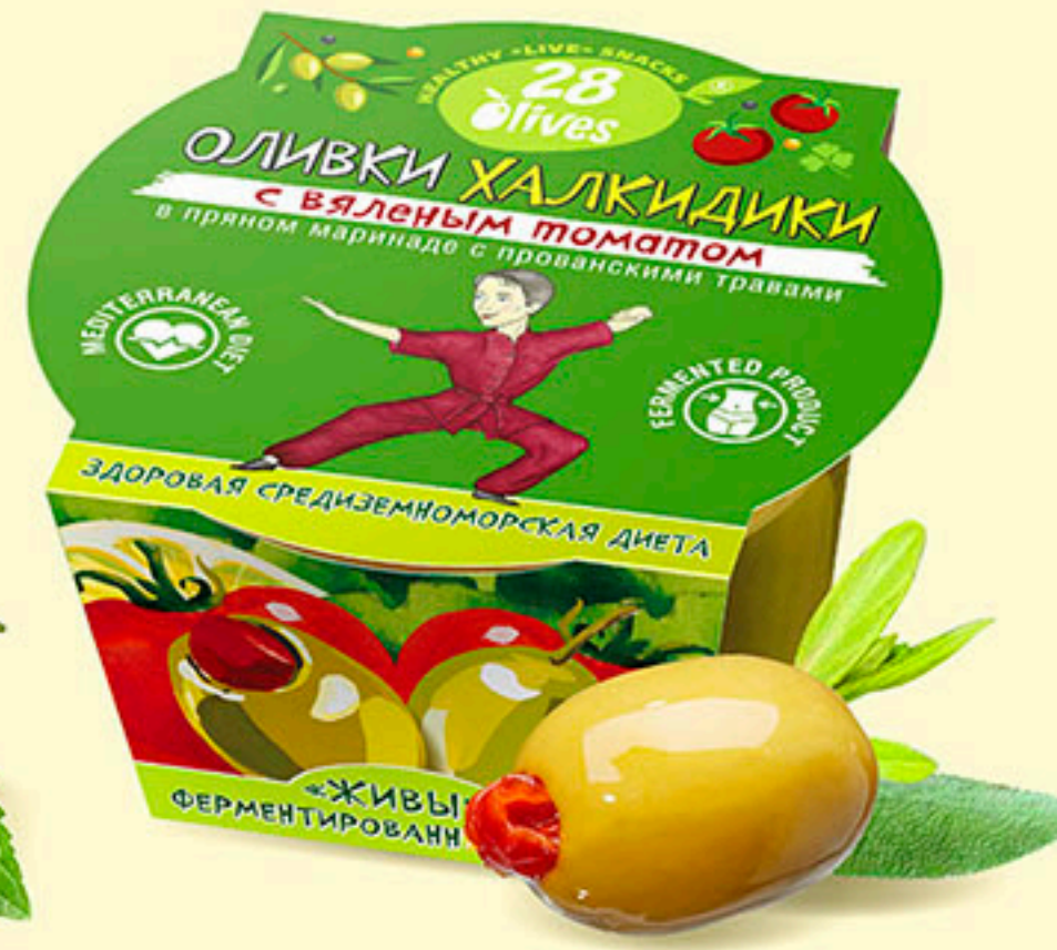
45 ОЛИВКИ ХАЛКИДИКИ с вяленым томатом в пряном маринаде с прованскими травами