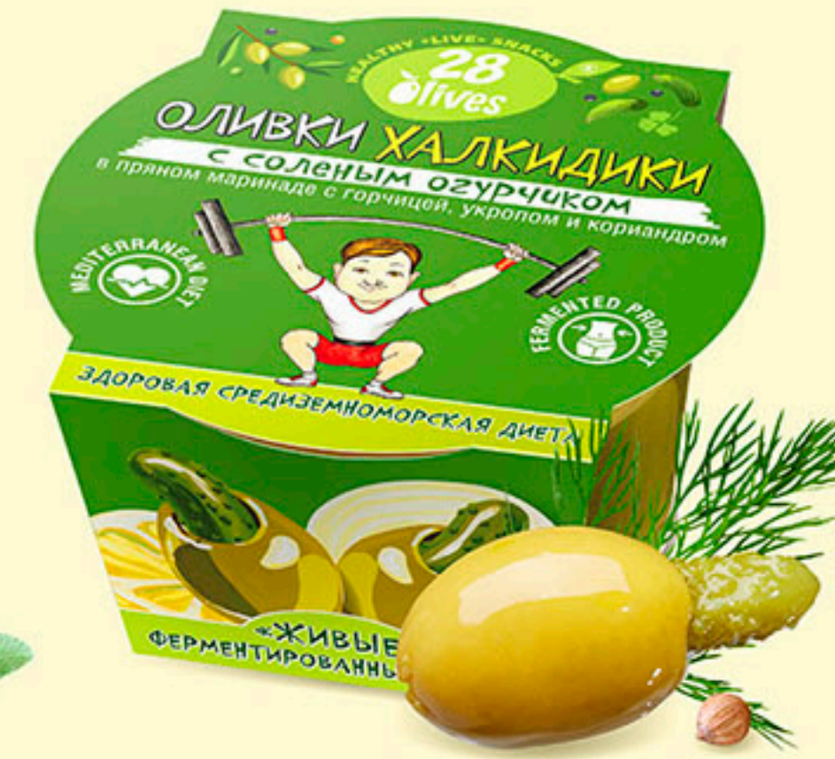
46 ОЛИВКИ ХАЛКИДИКИ с соленым огурчиком в пряном маринаде с горчицей, укропом и кориандром