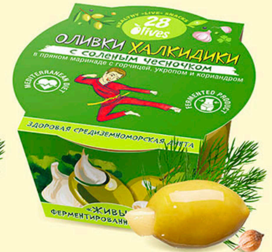
47 ОЛИВКИ ХАЛКИДИКИ с соленым чесночком в пряном маринаде с горчицей, укропом и кориандром