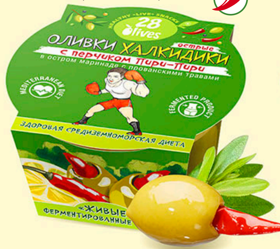
49 ОЛИВКИ ХАЛКИДИКИ с перчиком Тири-Тири в пряном маринаде с прованскими травами